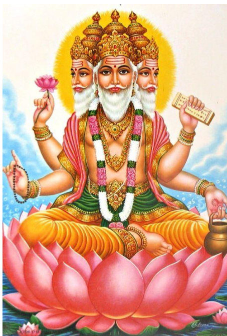
Obrázek 5 Bůh Brahma

Jiné zobrazování vyobrazuje Brahma jako červeného vousatého muže se čtyřmi tvářemi. Má osm rukou, v nichž drží čtyři vědy, žezlo, džbán s vodou z Gangy, obětní lžici, někdy také šňůru perel, luk a lotosový květ. Zřejmě nejznámější je socha Brahmy se nachází ve Svatyni Erawan v Bangkoku (Brožík, 2016).