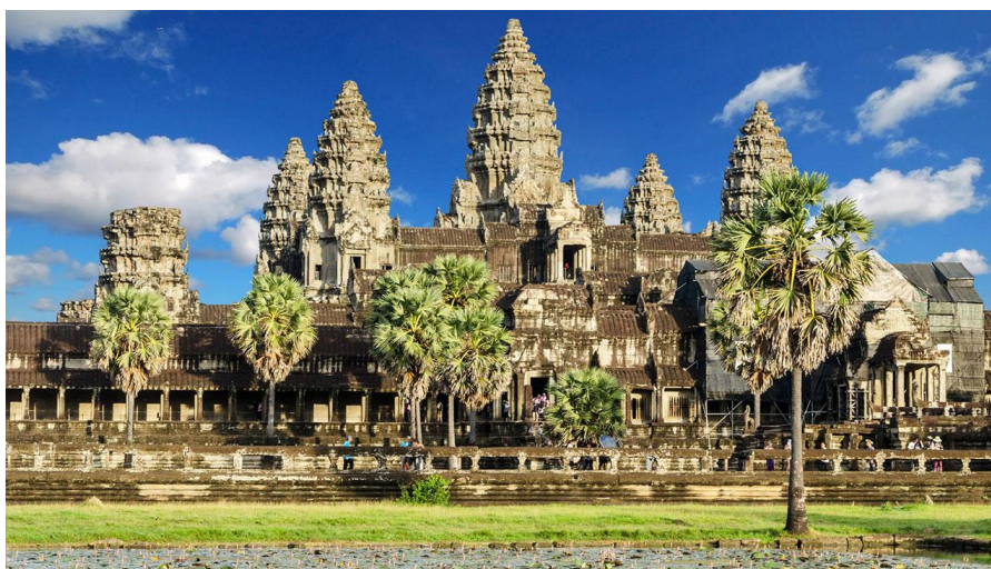
Obrázek 8 Chrám Angkor Vat

Mezi nejznámější chrám hinduismu patří Angkor Vat, který se nachází v Kambodži. Byl původně zasvěcen bohu Višnuovi, ale později se stal buddhistickým chrámem (Kokaisl, 2018).