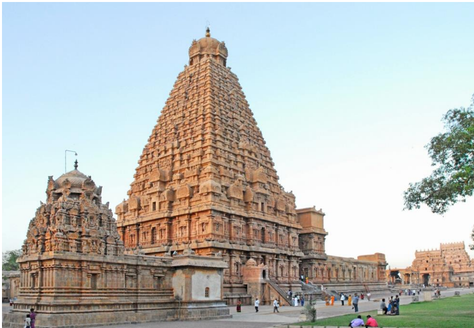
Obrázek 9 Chrám Brihadišvára

Dalším příkladem hinduistických chrámů může být například chrám Brihadišvára zasvěcený bohu Šivovi (viz. obr. 9) nebo chrám Nataraja rovněž zasvěcený bohu Šivovi (viz. obr. 10). Oba z uvedených chrámů se nachází v Indii.