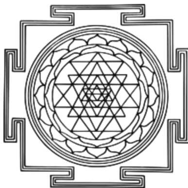
Obrázek 4 Šrí jantra

Mezi další symbol hinduismu patří symbol Šrí jantra. Tento symbol se vyznačuje devíti vzájemně propojenými trojúhelníky, které vyzařují ze středového bodu. Čtyři vzpřímené trojúhelníky představují mužskou stranu neboli boha Šiva a pět obrácených trojúhelníků reprezentuje ženskou stranu neboli ženskou kreativní energii Šakti. Šrí jantra reprezentuje pouto či jednotu jak mužského, tak ženského božství. Může také symbolizovat pouto či jednotu všeho ve vesmíru (Ancient Symbols, 2020).