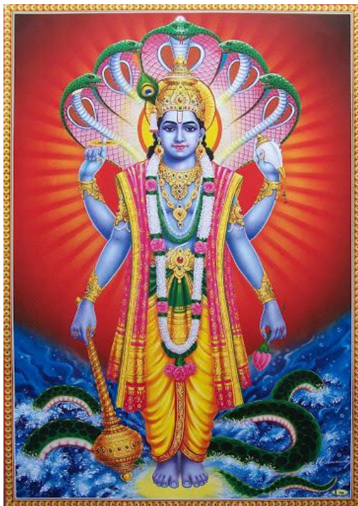
Obrázek 6 Bůh Višnu

Bůh Višnu je ochráncem a strážcem vesmíru. Jeho úlohou je se vrátit na Zemi v těžkých dobách a obnovit rovnováhu mezi dobrem a zlem. Višnu byl doposud devětkrát inkarnován, ale hinduisté věří, že proběhne desátá, poslední inkarnace, společně s koncem světa. Lidé, kteří uctívají boha Višnu, se nazývají višnuisté a vyznávají náboženský směr zvaný višnuismus.