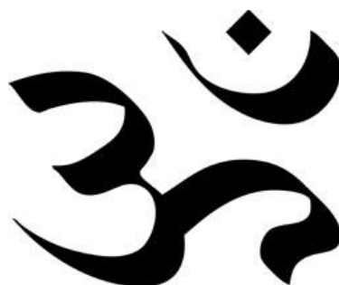
Obrázek 2 Symbol „Óm“

Jedním ze symbolů hinduismu je symbol „Óm“, neboli „Aum“. Zvuk tohoto symbolu je používán v meditaci. V hinduismu je slovo „Óm“ první slabikou v jakékoli modlitbě. Tento symbol vyjadřuje vesmír a absolutní realitu.