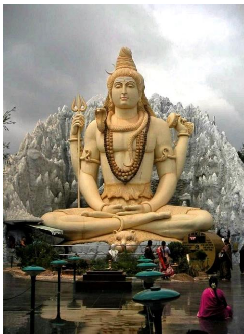
Obrázek 7 Bůh Šiva

Šiva je jeden z hinduistických bohů a nejvyšších bytostí. Bývá považován za hrůzostrašné apokalyptické božstvo, protože ničí vše, co brání duchovnímu vývinu. Hinduisté to však takto neberou. Smrt podle nich nebývá považována za definitivní konec. Mezi jeho hlavní symboly patří trojzubec, který představuje tvoření, udržování a ničení. Šiva nad nimi má kontrolu. Šiva bývá často označován pánem hadů, a to podle kobry obtočené kolem jeho krku. Ta má symbolizovat smrt, kterou Šiva překonal nebo hadí sílu. Na čele mu vyniká třetí oko, skrývající poznání a moudrost. Dalším atributem je nejposvátnější indická řeka Ganga, stékající po Šivových vlasech. Ganga představuje životní energii a očištnou schopnost. Mezi další symboly patří například půlměsíc, který je symbolem času nebo bubínek, jenž je považován za zdroj nástroje myslí mantry (Kokaisl, 2018). Na obrázku níže Šiva sedí s překříženýma nohama a medituje.