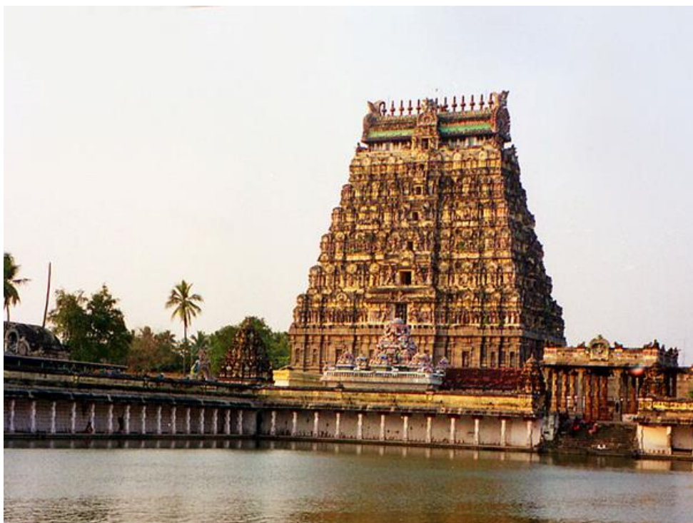
Obrázek 10 Chrám Nataraja