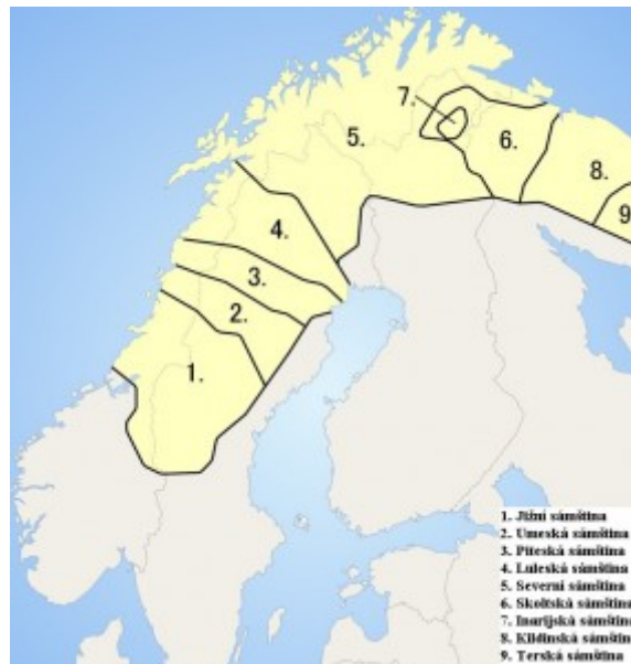
Obrázek č. 10: Výskyt sámských jazyků 53)