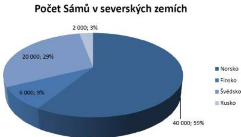
graf č. 1: Počet Sámů v severských zemích 10)

Žádné statistické údaje neuvádí přesná čísla sámské populace. Takové údaje jsou těžko dohledatelné, což je způsobeno mnoha důvody. Jedním z nich je asimilace sámského národa, jež zapříčiňuje, že mnoho Sámů v dnešní době již ani neví, jaké jsou jejich kořeny. Dalším důvodem je také to, že etnicita není při sčítání obyvatel zohledňována. 8) Ovšem obecné statistiky uvádí počet 85 000 až 100 000 tisíc lidí, přičemž alespoň polovina by měla žít právě v Norsku. Graf nám znázorňuje, že většina obyvatel hlásící se k sámskému původu žije na území Norska. Na druhém místě se nachází Švédsko, kde jich žije zhruba 29 procent z celkového počtu. Devět procent Sámů žije ve Finsku a na posledním místě v počtu sámského obyvatelstva je Rusko s pouhými třemi procenty. Z celkového počtu Sámů je cca 11 000 Sámů registrováno ve volebním seznamu, což je soupis všech Sámů nad 18 let věku, kteří se zapsali k volbám a účastní se voleb do Sámediggi (sámský parlament) . 9)