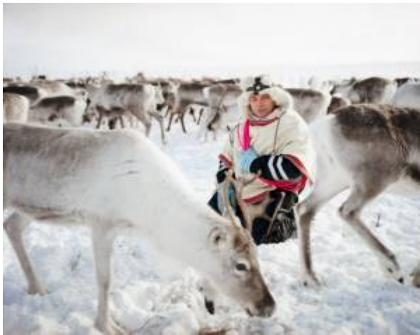
Obrázek č. 3: Pastevec se svým stádem 30)

Nejvýraznější sámským kulturním prvkem je chov sobů, který již odedávna, kromě hlavního zdroje potravy, přepravy a využití kůží, měl i náboženský význam. Pasterectví sobů je spojené s vnitřní podstatou sámských lidí, je to pro ně životní styl a smysl života. Práce pastevce je velmi náročná, pastevci nemají žádnou dovolenou, věnují se svému stádu celý rok, pracují v teplotách od minus 30 do minus 40 stupňů. V současné době jim práci ulehčují moderní technologie jako motorové sněžné saně či vrtulníky. U Sámů je vidět rozdělení mužské a ženské role, typické pro takový styl života. Role muže je v pasterectví samotném, v hlídání stáda apod., zatímco role ženy spočívá ve zpracování usmrcených sobů - opracování kůže, sběr krve (ta se poté využívá při vaření), porcování masa. Ženy mají však mnohem důležitější roli, ženy jsou srdcem a duší celé pasterectvé rodiny, jsou to právě ony, které budují zázemí pro chov sobů. Ačkoliv jsou sobi důležití i dnes, pasterectvím a dopravou se již zabývá jen zlomek obyvatelstva, cca 10% Sámů. Většina dnešních Sámů se živí rybolovem a turistickými činnostmi. Tento jev pramení též z faktu, že Sámové se pouhým pasterectvím nemohou v současné době uživit, mladé generace si uvědomují, že pokud se budou chtít věnovat pasterectví, budou si muset najít ještě další zaměstnání, aby pokryly své základní životní náklady. 29)