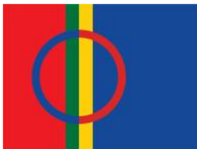
Obrázek č. 8: Sámská vlajka 44)

Barvy, shodné s těmi na sámském oblečení, také patří na sámskou vlajku, která je od roku 1986 společně s hymnou Sámi soga lávvla sámským symbolem. Vlajka zobrazuje čtyři roční období, z čehož modrá - zima, je nejdelší. Modrý půlkruh symbolizuje měsíc a červený představuje slunce. 43)