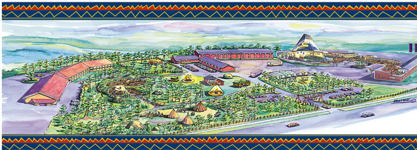
Obrázek č. 9: Sápmi park 49)