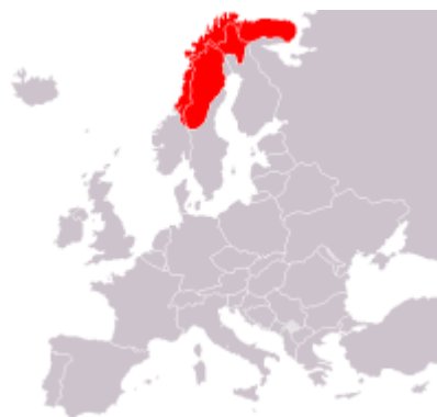
Obrázek č. 2: Oblast Sápmi 16)

Sámové obývají oblast zvanou Sápmi, více známou jako Laponsko. Tato oblast zahrnuje severní část Skandinávie a poloostrova Kola v Rusku. Spadá do subarktického podnebního pásma, z čehož převážná část leží až za polárním kruhem. Během zimní sezóny zde tedy panuje polární noc a v létě polární den, v průběhu kterého je vidět půlnoční slunce. V zimě je zase možné spatřit polární záři. Přestože Laponsko má rozlohu kolem 400 000 km 2 , nemá oficiálně vyznačené hranice, proto v rozlehlých tundrovitých plochách stěží poznáte, že se již v oblasti nacházíte. Navíc je oblast zalidněná pouze zhruba 2 000 000 obyvatel, což je 0,2 obyvatele na jeden kilometr čtvereční, z čehož sámské obyvatelstvo tvoří cirka 70 000. 13) V Sápmi jsou klasická čtyři roční období, nicméně sámové je tradičně rozlišují osm. 14) Dle území se také dělí samotní Sámové na lesní, fjellské a mořské. Lesní obývají hluboké lesy a živí se hlavně lovem, tato skupina spadá především do Švédska. Fjellští sámové jsou obyvatelé Finska, kteří žijí na takzvaných fjellech - bezlesých horách s kulatým vrchem. Norští Sámové jsou označováni jako mořští, protože obývají norské pobřeží a živí se, kromě chovu sobů, převážně rybolovem. 15)