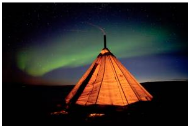
Obrázek č. 4: Lavvu 38)

Kvůli kočovnému stylu života bylo pro Sámy důležité zajistit si jednoduché dočasné bydlení, tím je lavvu - kuželovitý stan s dřevěnou konstrukcí. Bývá pokrytý kůžemi nebo kůrou a připomíná indiánské tee-pee. Na podlaze jsou vždy položeny sobí kůže, uprostřed přenosná kamna, kolem kterých rodina sedí, vypráví si příběhy, pije kávu a užívá si celkovou atmosféru, která pro ně znamená domov. 35) Další výhodou je jednoduchost stavby lavvu , což Sámům umožňuje rychlé přesuny se svými sobími stády. Konstrukce lavvu je navíc schopna ustát divoké větry ve skandinávských tundrách. 36) V současné době je život Sámů již dost civilizovaný. Ve městech můžeme najít supermarkety, restaurace a jiná podobná zařízení. Těž bydlení je moderní, ale ponechalo si něco z minulosti, domy jsou většinou stavěné z dřevěných panelů. Právě dřevěné domky byly dřív obydlí pro řemeslníky či rybáře. Způsob bydlení totiž úzce souvisel s vykonávaným povoláním. Pastevci sobů tedy stále využívají lavvu při svých kočovných poutích. 37)