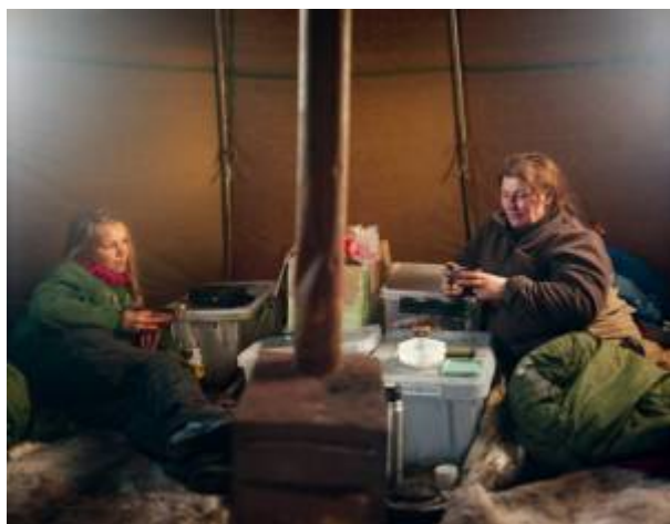
Obrázek č. 5: Lavvu uvnitř 39)